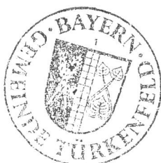
Pius Keller Erster Bürgermeister