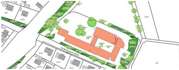
Ein Ausschnitt aus dem neuen Kataster.

Anfang des Jahres hatte die Gemeinde die Einführung eines Baumkatasters beschlossen. Seitdem wurde der öffentliche Baumbestand entlang von Straßen und Wegen sowie rund um kommunale Liegenschaften erfasst und dokumentiert. Inzwischen ist das Baumkataster vollständig. Rund 670 Bäume wurden aufgenommen und im Hin-