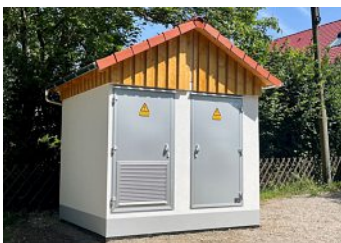
Die neue Trafostation.

Die Stadtwerke Fürstenfeldbruck haben in der Saliterstraße eine neue Trafostation aufgebaut. Der nahegelegene kleine Wertstoffhof ist weiterhin uneingeschränkt erreichbar und bleibt dies auch zukünftig. Auch