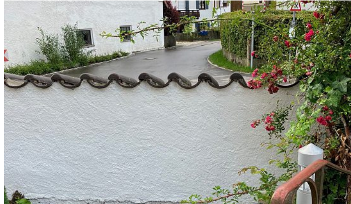
Die instand gesetzte Mauer.

Auf dem Türkenfelder Friedhof waren die Handwerker tätig. Die schadhafte Friedhofsmauer wurde instandgesetzt und erhielt innen und außen einen neuen Anstrich.