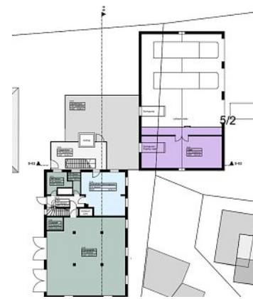
So soll der fertige Bau im Plan aussehen. GEMEINDE TÜRKENFELD

Die Grobkostenschätzung für den Erweiterungsbau inklusive