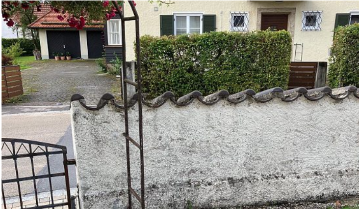
Die Friedhofsmauer vor der Sanierung.