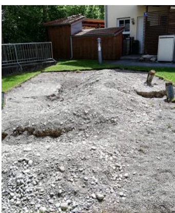
Hier sollen bald viele Kinder Spaß haben können.

ter und anerkannter Spielplatzausstatter damit beauftragt. Die Firma wird den Fallschutz verlegen sowie eine neue Nestschaukel, eine Doppelschaukel und ein Spielhaus aus Robinienholz installieren. Die Kosten belaufen sich auf 14 000 Euro, können aber unter Umständen durch anteilige Mithilfe der Gemeinde-Handwerker noch gesenkt werden.