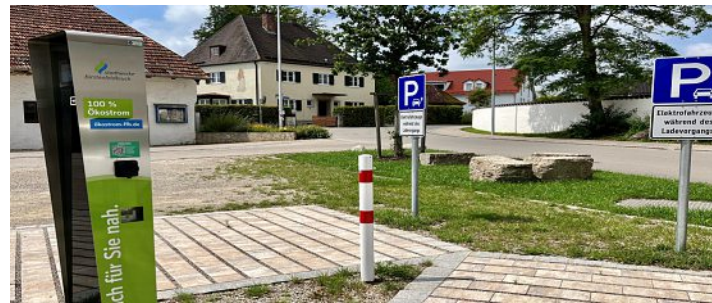
Die viel genutzte Ladesäule.

Die Zahlen belegen eine erfreulich hohe Auslastung der E-Ladesäule, welche in Zukunft vielleicht sogar noch steigt.