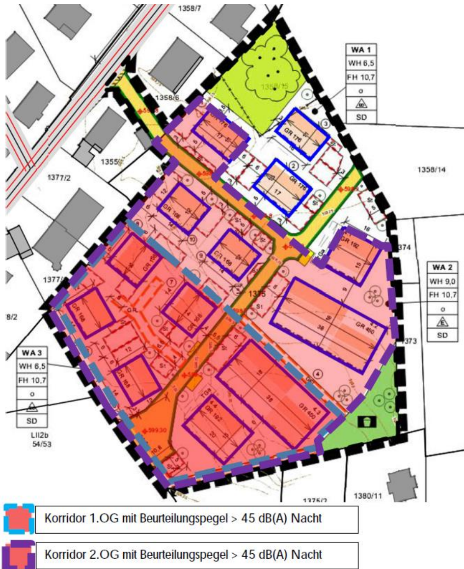
Abbildung aus dem Bericht zur Schalltechnischen Untersuchung der Möhler + Partner Ingenieure AG vom 06.09.2023

sind nicht zu erwarten. Im Schallgutachten werden Bereiche definiert, die auf Basis der Ermittlung der freien Schallausbreitung im Plangebiet eine nähere Untersuchung auf nachgeordneter Planungsebene erforderlich machen, wenn darüber hinaus die Orientierungswerte nach DIN 18005 eingehalten werden sollen (siehe folgende Abbildung aus dem Gutachten).